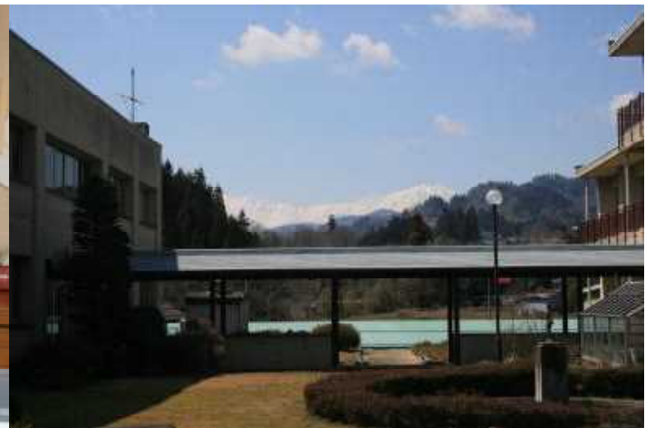
昇降口から見える北アルプス