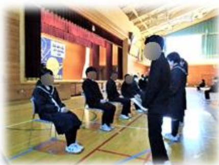
【1, 2年生からのプレゼント贈呈】