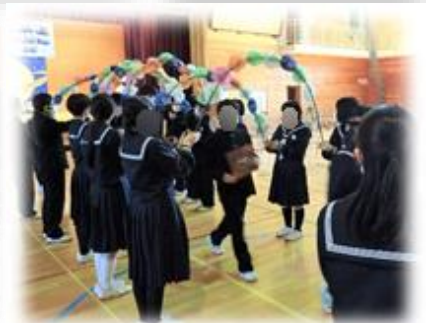
【花道を笑顔で退場する3年生】