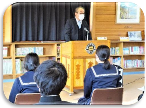
【山崎校長先生入会にあたって】