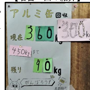
【アルミ缶目標掲示】