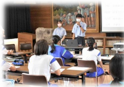
【学習センターでの進路講話】