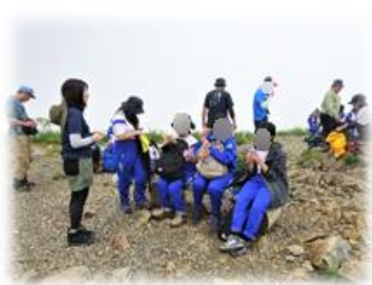
【八方池周辺で小休止】

二日目は、白馬 EX アドベンチャーでの研修です。チームビルド、ローエレメントは、インストラクターと対話しながら活動しました。チームで協力しなくてはできないゲーム中心なので、コミュニケーション能力などが培われました。この活動を通して、学級の団結が高まったと思います。ハイエレメントは一步踏み出す勇気を学びました。