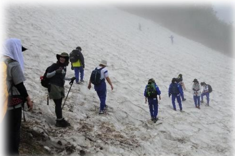
【残雪多く下山する】