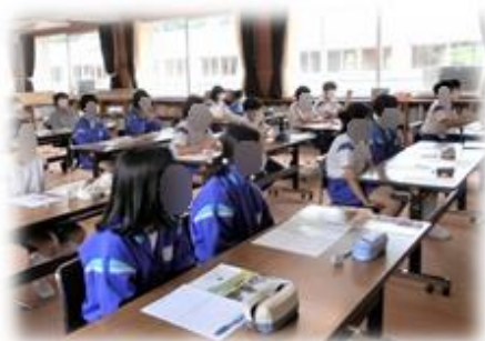
【真剣に話しを聞く生徒たち】