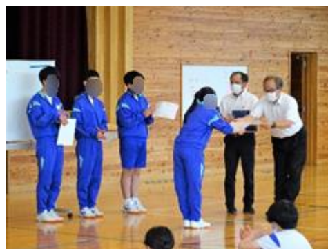
【賞状伝達式の様子】

文化部のみなさんは、第22回毎日パソコンコンクール6月大会において優秀な成績を収めました。