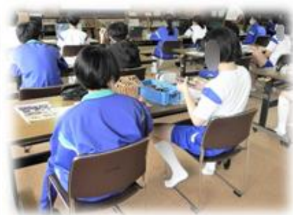
【紹介された資料を見る生徒】