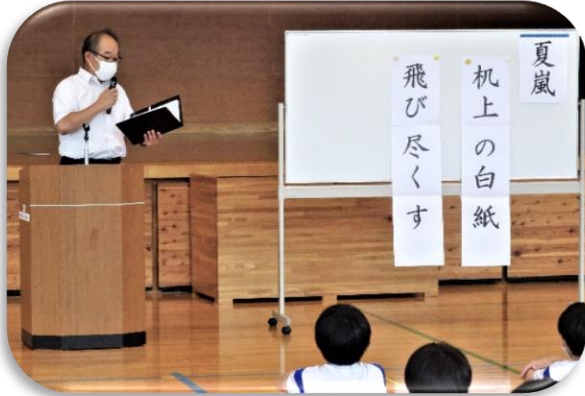
【俳句を詠みながらの校長講話】