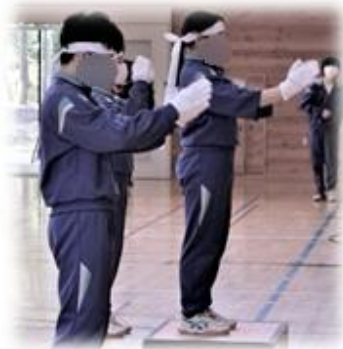
【評議・生活委員による応援】